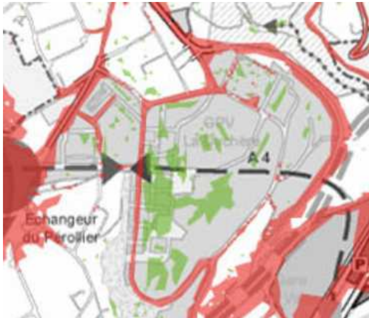
Quartier La Duchère