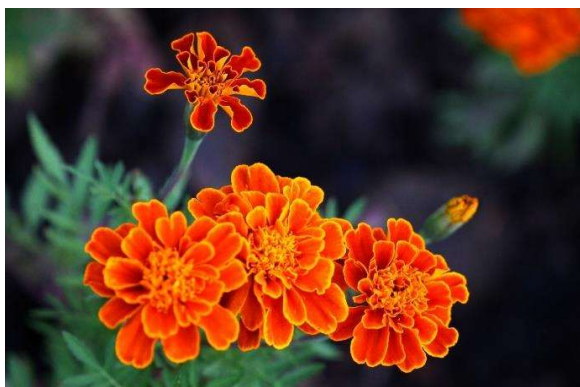
Œillet d'Inde ©PEAK99, CC BY 3.0 < https://creativecommons.org/licenses/by/3.0/ >, via Wikimedia Commons

Le parcours sera présenté au public du 27 avril au 17 septembre 2023 dans le Jardin botanique de la Bastide et dans le Jardin botanique du Jardin public.