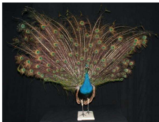
Paon bleu

Ces événements géologiques expliquent la géographie actuelle de la péninsule indienne, son territoire étant parcouru de massifs, plateaux et plaines. Associées à une variété de climats, ces caractéristiques géographiques sont à l'origine de l'existence de milieux variés et font de la péninsule un territoire à la biodiversité remarquable.