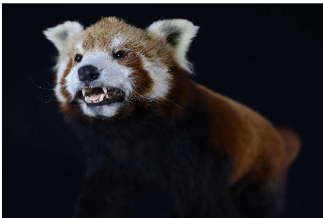
Panda roux

Des espèces de ce milieu, à retrouver dans l'exposition : la panthère des neiges, l'urial, le tahr de l'Himalaya et le panda roux.