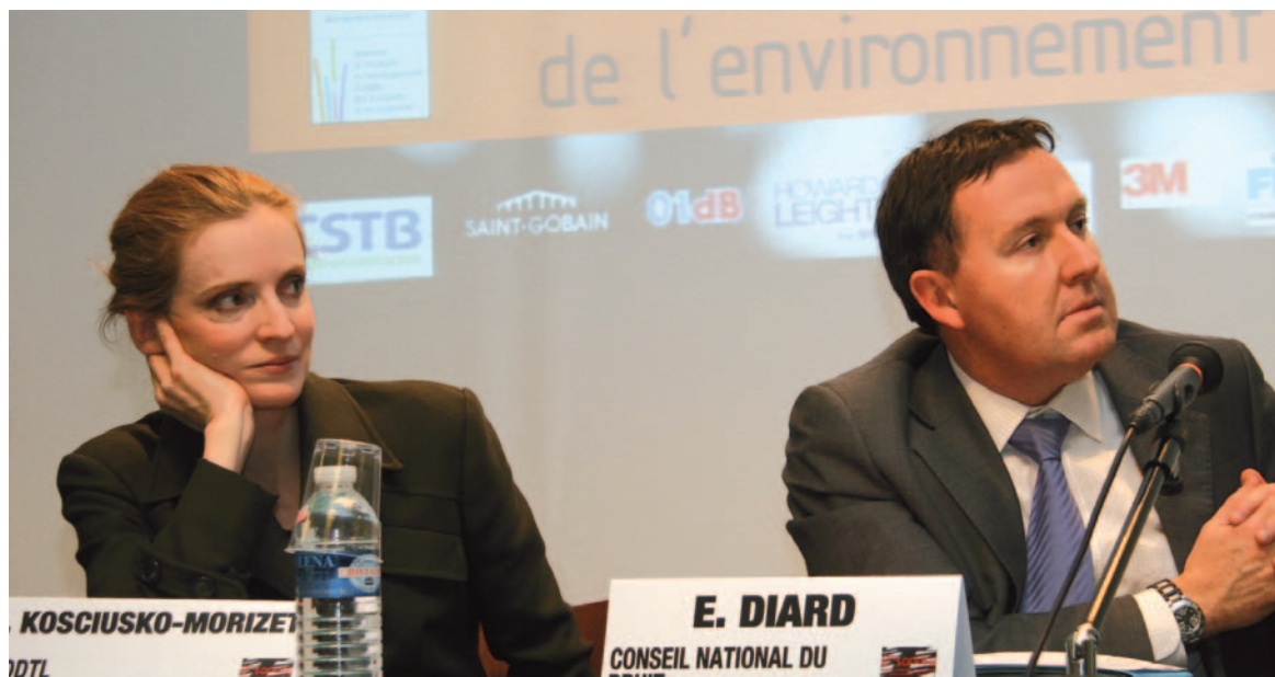
Mme Nathalie KOSCIUSKO-MORIZET, M. Éric DIARD

Ce discours de Monsieur Éric Diard présente à la Ministre de l'Écologie, du Développement durable, des Transports et du Logement, ainsi qu'à tous les membres des Assises du bruit, le bilan de l'activité du Conseil National du Bruit ainsi que ses projets d'actions pour 2011.